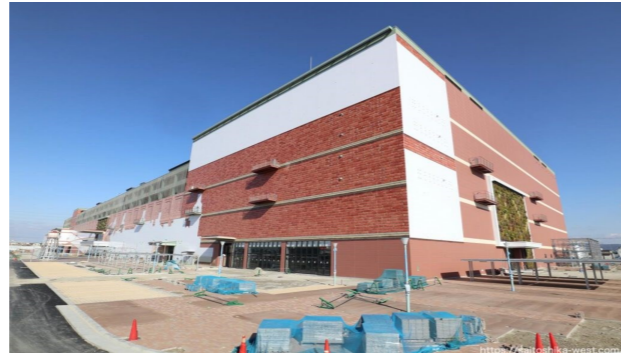
南西側から見た様子↓

次々と大型の店舗ができていくのはうれしいですが地元民としては現在活気のある近鉄天美駅近くの商店街が、こういう時代の流れが原因で閑散としたシャッター通りに変わっていくことがないようにしてほしいものです。