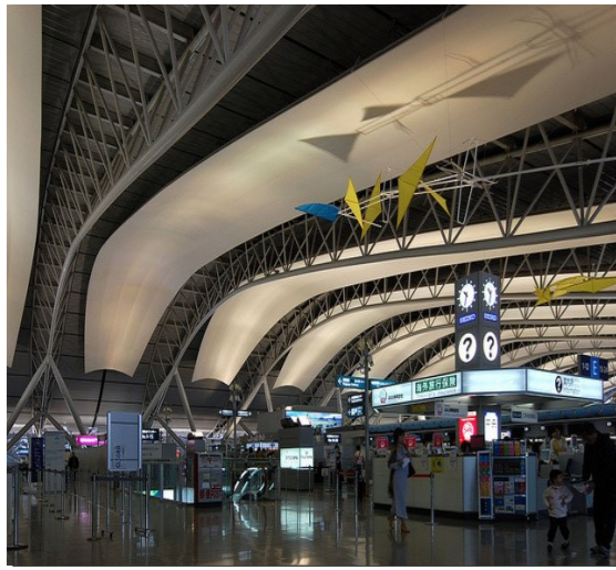
← 関西空港ターミナルビル内

関西国際空港、1千億円規模の大改修大丈夫？ 大阪万博やR（総合型リゾート）を見据えて関西空港を運営する関西エアポートは2025年までに受け入れを現在の7割増しの4000万人に引き上げると発表したが、令和元年12月。1千億円のこの計画